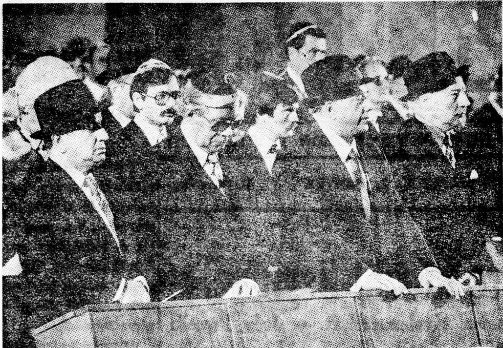
A német állam vezetői, Walter Schell szövetségi elnök és Helmut Schmidt kancellár, az újjáépített kölni zsidó főtemplomban a Kristályéjszaka 40-ik évfordulóján tartott emlékünnepeken.