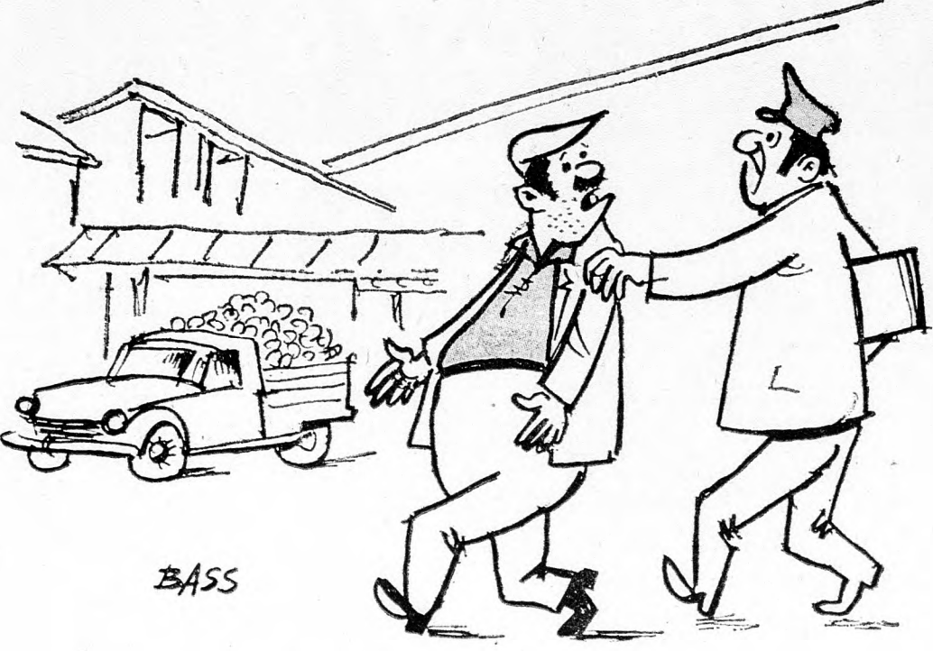
MI TÖRTÉNT EGYSZERRE?

A jövedelmi adóhivatal megállta a tel-avivi vásárocsarnokot. (A sajtótól)