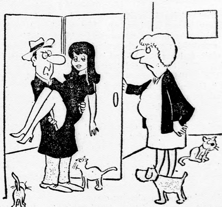
— Nekeo szabad gazdátlan kutyákat és cicákat összegyűjteni az utcáról?