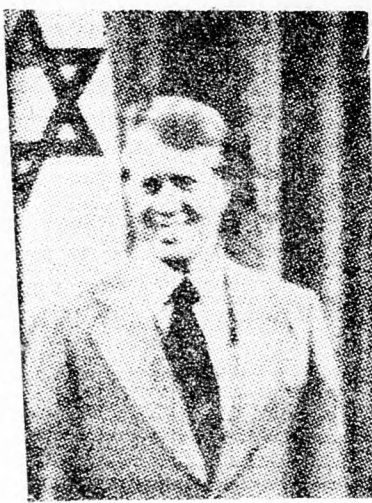
JIMMY CARTER Minden befolyása latbavetésével

írását, amely feljogosítja Egyiptomot arra, hogy hatálytalanítsa azt, amennyiben szükségnek tartja.