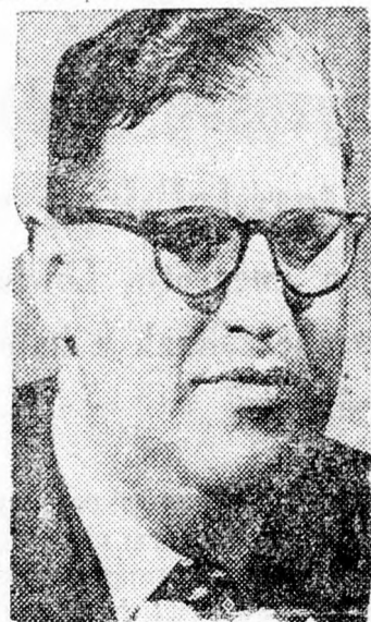
ABA EVEN Az első kairói nagykövete?

fontos személyisége a legnagyobb ellenzéki pártnak. Ha a Máarách