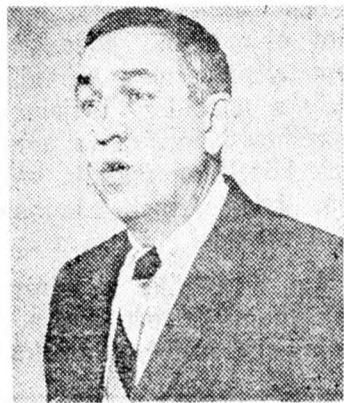
JOSEPH SISCO az amerikai jelölt

Amerikai politikai körök három jelölt nevét emlegetik, akik a washingtoni külügyminisztériumot képviselhetik a hármas megbeszéléseken. Legvakrabban Joseph Sisco nevét hallani, aki éveken keresztül Henry Kissinger volt külügyminiszter helyetteseként vett részt az Izrael és szomszédai közötti tárgyalásokon, kitűnően ismeri a kérdést, mert komoly szerepet töltött be az első csapatválasztási egyezmény, majd pedig az átmeneti egyezmény létrejöttében. Sisco