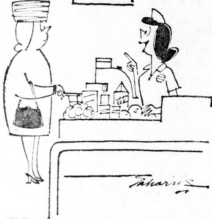
— Sokallja, asszonyom? Gondoljon arra, hogy ezért a jövő héten 100 fonttal többet fizetne...