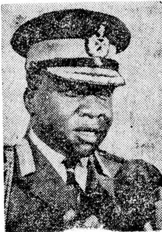
AMIN Bottal üthetik...

Ugandából érkező jelentések szerint Idi Ámin, a megbukott diktátor magánrepülőgépén elme-