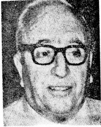
MESEL: Csak egyetértésben a Hisztadrutal

gondoskodni kell a munkaerők egyensúlyba tartásáról és rámutatott arra, hogy sem az izraeli, sem pedig a területeken