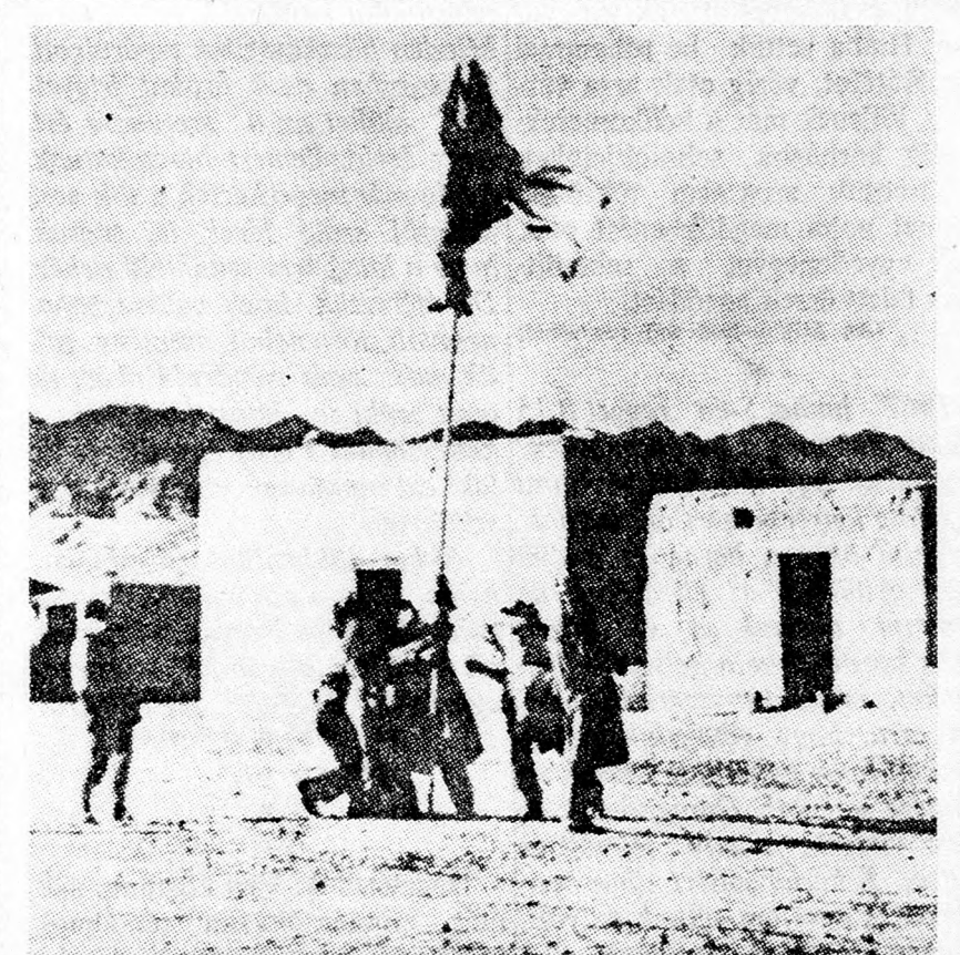
Az Ovdá-hadművellet, az utolsó katonai akció a függetlenségi háborúban. A Negev és a Goláni brigádok kifúzik az izraeli zászlót Ejlátnban, a Vörös-tenger partján.

TEL-AVIV - ZOA- ház szombaton, május 5-én 8.30-kor MARICA GRÓFNŐ NAGYOPERETT 3 FELVONÁSBAN