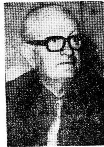
EHRlich Ötéves terv...

Beirut. (UPI) — Chádád őrnagy keresztény miliciái tegnap azzal fenyegettek, hogy tűz alá veszik az UNO által ellenőrzött övezetben lévő Tibnin falut, ha az nem csatlakozik az általuk ki-