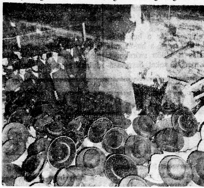
A nagyomnyos magya meggyújtása a „Resol” sírja felett Meronban lág-beomer napján

Hatvan év mult el csupán a templom pusztulása óta. A rómaiak olyan pusztítást végeztek a lakosságban, hogy annak száma egymillióra csökkent. De ez a kevés ember is, itt, a saját hazájában, elégséges volt ahhoz, hogy ne tőrje némán azt a római polititkát, amely idegen városra akar