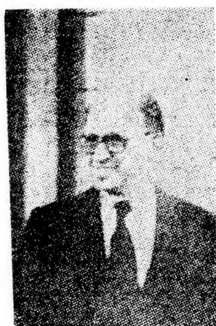
BEGIN MINISZTERELNÖK Jeruzsálem oszthatatlan

(Mint emlékeztet, Szádát néhány nappal ezelőtt azt a panaszt hozta fel Begin ellen, hogy Izráel