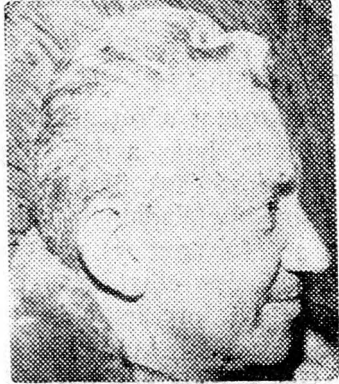
CHAJIM BÁR-LÉV Nem szükséges

lektuális becsületességgel és civil- kurázssal, hogy bevallja, misze- rint felfogása értelmében a judeai és somroni település Izráel joga, amelyet a kormány azonnal és mindenütt megvalósít. A kormány azonban nem ezt tette, hanem a letelepüléseket biztonsági indokok