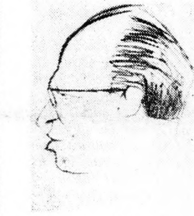
BEGIN Nem trombózis...

„Ugyanakkor azonban az orvosok megállapították, hogy el-