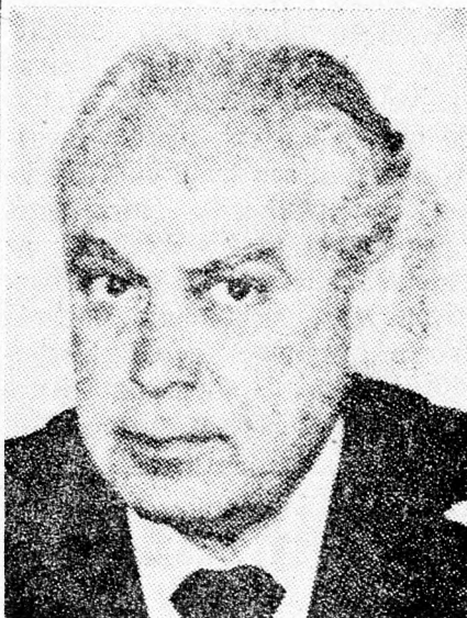
ROBERT STRAUSS Egyetértés Szádáttal

Ezt arra a feltételre alapozza, hogy Carter elnök már közel állt ahhoz, hogy létrehozzon megállapodást Szádát és Begin között a camp-davidi tárgyalások utolsó fázisában tavaly szeptemberben, azonban az amerikai elnöknek végül is nem sikerült olyan megszö-