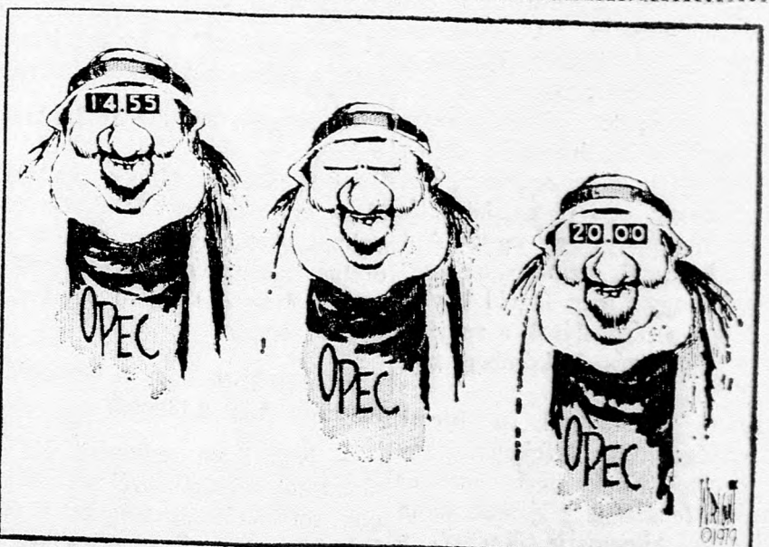
A BENZIN-ÁRAK EGY SZEMPILLANTÁS ALATTI VÁLTOZNAK!