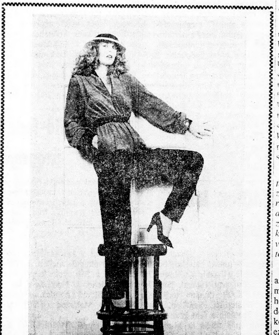
Az idei őszi divatot a kihangsúlyozott váll, a vékony csipő és a srégen lefelé futó zseb uralja. Képiünkön az Ávi Modell egyik 1979/80. évi őszi kreációja.

adóját, ami a gépek jelentős olcsóbbodását vonja maga után. Ugyancsak csökkentik a szines televíziók vásárlási adóját és ez néhány ezer fontos árcsökkenést okoz.