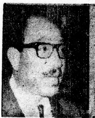
SZADÁT: Pszichológiai okok...

Azt is hangsúlyozta az egyiptomi elnök, hogy kormánya elfogadta az amerikai-szovjet kompromisszumot az UNO-megfigyelők ügyében, de Izrael elutasította ezt, mert ellenszenvvel viseltetik az UNO és különösképpen annak főtájkára iránt. A továbbiakban annak a meggyőződésének adott kifejezést, hogy ez a probléma nem fogja zavarni a bekefelyamat folytatódását és