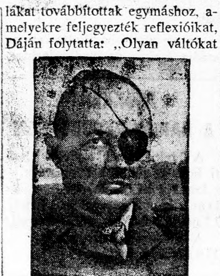
DAJÁN „En sem hiszem”

frunk alá, amelyeket nem tudunk törleszteni. Nálunk nem kerül sor lemondásokra, hanem csak átcsúszunk a különböző belső válságokon”.