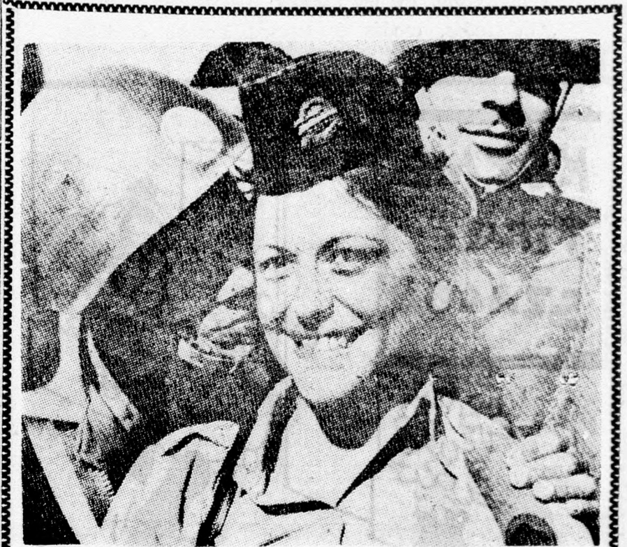
A BÉKE MÉZESHETEI

Egyiptomban aggodnak a jövőtől, de azért általában derülőtől tekintenek előre. Egyik ottani beszédpartnerem ezt mondta: „Ha a nehézségeket tekintem, előttem a gondok. De ha a máig leküzdött nehézségeket tekintem, akkor megerősödök bennem a derülletés.”