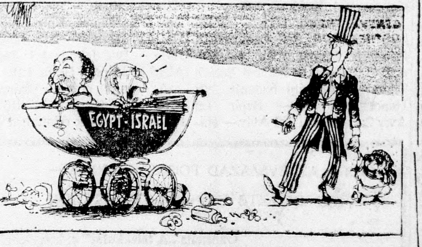
— Nézd, Anuár, kit akar a papa benyomni a mi kocsinkba! (Weltwoche — Zürich)

ELŐADÁSOK KEZDETE 4.30 — 7.15 — 9.30 ATTENBY: A harcosok csoportja BEN JEHUDA: Rohanás az életért CAFON: Vegyék elő zsebkendőjüket CHEN: Bulldozer a nevem CINEMA-1: Jimmy Hendrix el CINEMA-2: Hazatérés ESZTER: Az állat és az ember GAT: A kutyás ember diadala DEKEL: A „Vidámak” ketrece GORDON: Spiedermann újra itt DRIVE IN: Szélhámosok a titkos zatos kastélyban HOD: Uttörő fordulat LIMOR: Nyár előtt MATMID: Vágyak szállodája MAXIM: Hollywood kedvencei MOGRABI: A szarvasvadász OFIR: Jimbuck ORLI: Film, film PARIZS: Esküvő PEER: Agatha SÁCHAF: Állandó partnerek STUDIO: Szeretb TCHÉLET: Mennyben töltött napok TEL AVIV: Moonraker