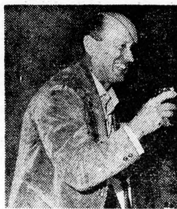
DAJÁN KÜLÜGYMINISZTER Még a visszadás előtt...

náji területet, amelyet az eredeti program szerint a jövő hónap közepén vissza kell adnia Egyiptomnak.