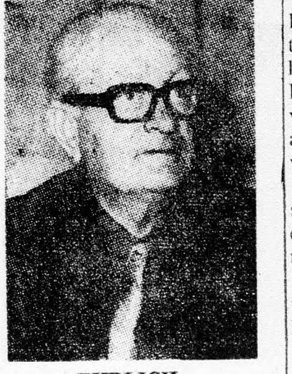
EHRLICH Mégis marad?

Mindezt tény, hogy a szubvenciók problémája egyre sürgetőbbé válik, mert az izraeli font felgyorsult leértékelése az utóbbi hetekben nagyobb költségvetési összeget tesz szükségessé a szubvenciók céljaira, mint eredetileg gondolták. Mint ismeretes, augusztusban 50 százalékkal csökkentették a szubvenciókat. További gazdasági lépés, melyről az illetékeseknek a közeljövőben kell határozni: az üzemanyag árának emelése. A már említett, felgyorsult leértékelődési folyamat nagymértékben növelte a kiadásokat izraeli fontban üzemanyag-beszerezés céljaira, minthogy pedig a kormány célja az, hogy ne finanszírozza a nagyközönség számára eladásra kerülő üzemanyag árát. Szükségessé válik az üzemanyag árának emelése a folyó hó végén, vagy a jövő hónap elején.