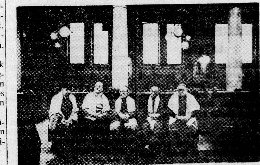
KAIRÓI ZSINAGÓGA. MINJANRA VARVA...

Amikor kihírdették az ítéletet, a lány ezeket mondta: „Pedig olyan szép kellemgődröcskék voltak az arcán...”