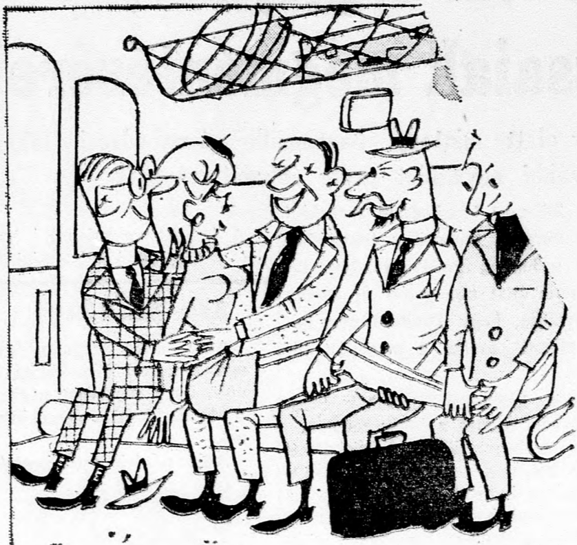
— CSAK NEM GONDOLTA KISASSZONY, HOGY HAGY-JUK ÁLLVA UTAZNI?

(Ami elmondott, azt csak évek multán voltam képes leírni. Ami-kor már elhittem magammal, hogy semmi sem volt igaz mindab-ból, amit láttam. Amikor elhitet-tem magammal, hogy LESÁT csak álmodtam, hogy ilyen bolygó nem forog a világűrben.)