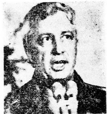
SARON Vérvörös arccal...

amikor megállapította, hogy ma-gára maradt szélsőséges nézetei-vel. A kormány titkára részletezte, hogy Givont bizonyos meny-nyiségű állami, illetve zsidó ma-gántulajdonban lévő földdel bő-vítik ki. Bét Churont (amelyet más területre helyeznek át) és