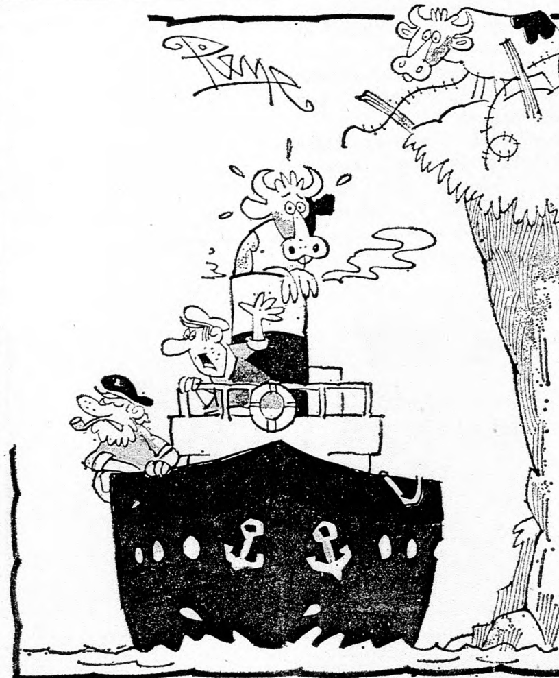
— Ha te is 30 évig járod majd a tengereket, kölyök, nem fogsz minden apróságon csodálkozni...

Irta: RÖSSEL MORDECHAJ nagyon elterjedt Izraelben, mert maguk a szülők sem maradnak szívesen gyermekeik házában.