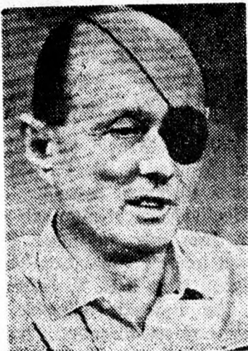
DAJÁN: Izrael legnagyobb kalandja...

A könyv elárulja, hogy az eset után Begin nem egyezett bele ab-