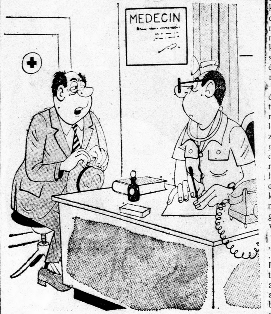
— A horkolástól szabadítson meg doktor úr! Már harmadik állásomat veszttem el miatta.

Beiruti jelentés szerint fokozódó feszültség mutatkozik Szíria északi részében, Aleppo körzetében, ahol már negyedik napja folynak az összecsapások a szíria hadsereg és a Muzulmán Testvérek fegyveres csoportjai között. A Muzulmán Testvérek agyonlöttek egy szíria őrnagyot, egy alap poi mcssetben pedig bomba robbant.