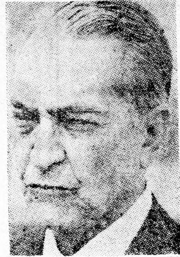
Dr. MUSZTAFÁ CHÁLIL