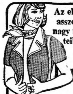
Az elegáns asszonyok nagy méreteiben is

20 ezen megérték a felszabadulást. 30–35 kilós emberek.