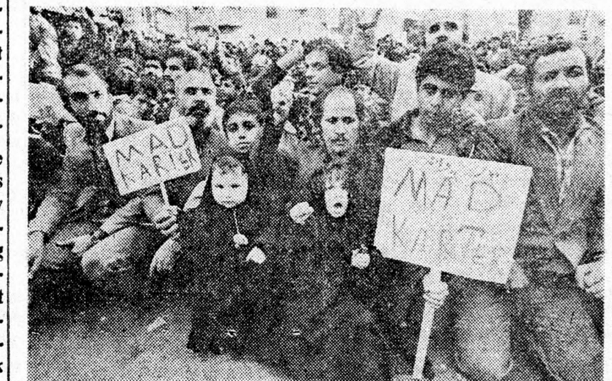
TÜNETEK A TEHERÁNI AMERIKAI KÖVETSÉG ELŐTT. A TABLÁK FELÍRATA: CARTER ÖRÜLT!

Az okmány már az irattárban fekszik és nagyon valószínű, hogy a bizottság tagjainak a többsége már el is felejtette a tartalmát. A probléma azonban megmaradt. Azok, akik fievelemmel kísérik az izraeli arabok politikai aktivizálódását, tudják, hogy nem szabad közömbösnek lenni. Azt követelik, hogy mondják meg az igazat az izraeli arabok kérdésében, ne soperjék a szőnveg alá és a kérdést és ne állítsák, hogy „jelentéktelen kisebbség” vall szélsőséges nézeteket. Azt akarják, hogy a kormány nézzen szembe a tényekkel és találjon rájuk idejében orvoslást.