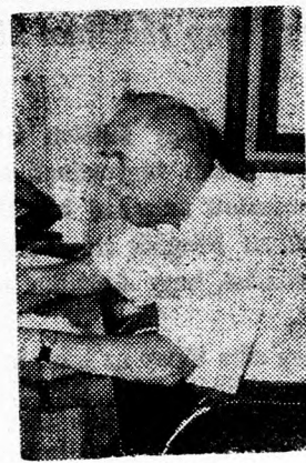
MESEL: A kormány hibás

ményezett lépések okozták, mint például az üzemanyag árának