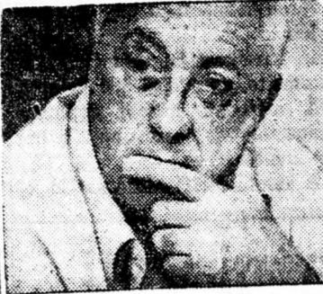
SÁRON: Ki a mi emberünk?

„Nagy kár, hogy a kormány tagjai a pártérdekeket az államérdek fölébe helyezik.”