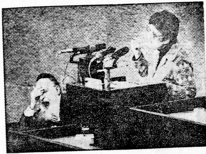
CSENDELET A KNESZETBEN

Állítólag Brezsnyevet is ő állította talpra — kézzelre- vással.