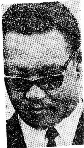
Kérdés: Szóval Burg hazudik? Lászkov: Ez nem a terület, amihez én viszonyulhatok. Ilyen dolgokkal nem foglalkozhatom.

Kérdés: S nem érdeklődött, hogy mi az „öszibarack-dosszié” tartalma?