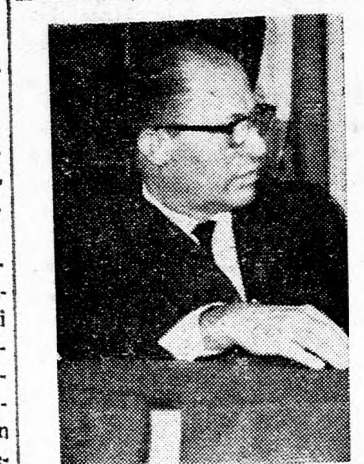
MENACHEM BEGIN Még nem döntött

ció vezetőjének elnöke. Becs- lésük szerint a kormányt leg- alább 62—63 képviselő támogat- ja a Kneszetben, amivel meg le- het akadályozni az ellenzék ter- vét, hogy a választások időpont- ját közelebb hozzák.