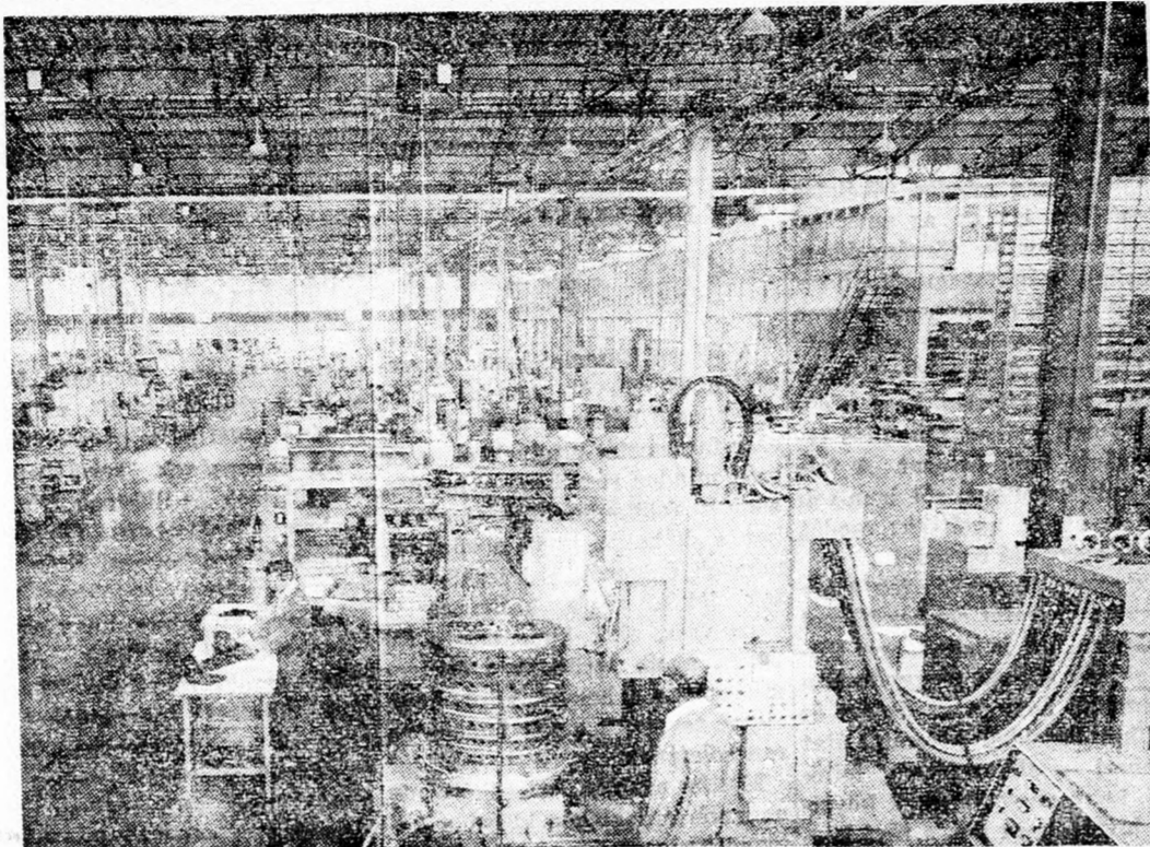
A GYÁR EGYIK CSARNOKA

Saját iskolát is fenntart a gyár. Százötven diák tanul itt és szinte „az anyatejfel” szivják magukba a repülőgépmotor szerelés titkait. Négy éves az iskola, annak elvégzése után a had-