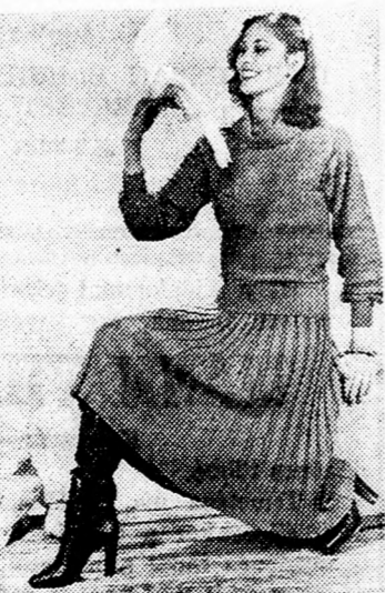
Az izráeli Dorina kötszövőüzem bemutatja egyik új, két-részes téli modelljét.

ben, a Biztonsági Szolgálat mindenkorai főnökének nevét nem szabad semmilyen publikációban közölni, csak azután, hogy távozik magas beosztásából és utódjának adja át a helyét.