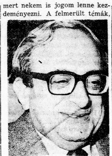
NÁVON: „Tisztában vagyok jogaimmal...”

A tévé népszerű Mokéd interjú műsorában holnap Jicchák Návon államelnök jelenik meg a képernyőn, és — többek között — az államelnöki hivatal működéséről, az elnök feladatköréről és társadalmi problémákról fog nyilatkozni — közölte Tuvia Száár, a tévé hírosztályának igazgatója. Návon elnök vasárnap este a Mábát hírmagazin keretében a leghatározottabban elutasította a Likud egyes tagjai részéről nyilvánított bírálatot afölött, hogy hajlandónak mutatkozott megjelenni a Mokédban.