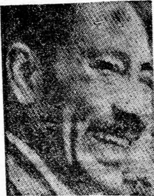
SZADÁT Erélyes figyelmeztetés

ATHEN, — Eurhelios a neve annak a naperőműnek, amely Szicíliában, az Etna lejtőjén épül. A tervek szerint az ez év végén felavatandó erőmű több mint 6000 négyzetméter együttes felületű tükröknek a rendszere lesz. E tükrök a napsugarakat az 55 m. magas torony csúcán levő tartályra fókuszolják, amelyben 4300 kg gőz fűtődik fel, amely turbinát hajt.