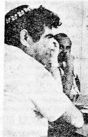
HAMMER közoktatásiügyi miniszter

Begin miniszterelnök, Hammer közoktatásiügyi miniszter és Ari