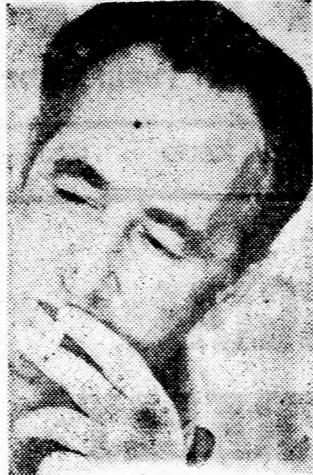
PERESZ: Senki sem mond le a Golánról

Rámotban Peresz kijelentette, a Máarách tisztában van azzal, hogy tulajdonképpen a Golánon kompromisszum nem jöhet számításba, azonban — tette hozzá — nagy hiba volna ezt a szót ki törölnünk a politikai lexikonból. A Golán-törvényre — véleménye szerint — nincs szükség, mert nem nehezedik ránk nyomás, és nincs nemzetközi diktátum a Golán-fennsíkkal kapcsolatban, tehát tényeket kell teremtenünk. „Rövid időn belül 10.000 lakos lehet a Golánon, Kárcin város ki fejlesztése, és a mezőgazdasági tervek végrehajtása révén”. A továbbiakban a Munkapárt elnöke ezeket mondotta: — A Golán valóban elválaszthatatlan része Izraelnek. Ezzel egyidejűleg azonban azt mondjuk, hogy hajlandók vagyunk tárgyalni a szíriaiakkal határkiigazításokról, ha ők békét akarnak. Sajnos, reális értelemben ez nem áll fenn. Nem ismerem senkit az