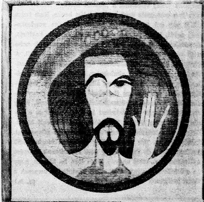
FUX PÁL: „A ZSOLTÁROK” SZOROZATBÓL