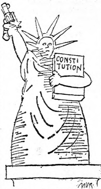
Reagan a tízedik amerikai elnök, aki ellen merényletet követnek el

A szerkesztőség nem felel a hirdetések tartalmáért. — Kéziratokat nem őrzünk meg és nem adunk vissza.