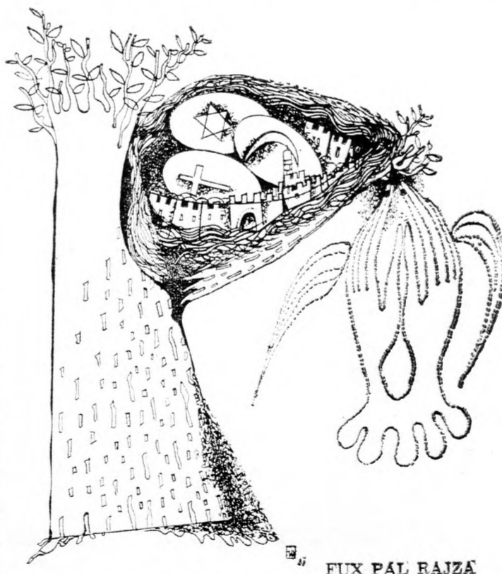
FUX PÁL RAJZA