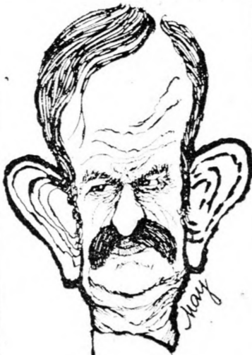
ASZÁD A Golán oroszlánja...

Damaszkuszi politikai megfigyelők szerint Aszád szíriai elnök elhatározta, hogy a „végsőkig megy” és erre utal a Chábib iránt tanúsított udvariatlan magatartás is. Aszád, aki előszeretettel használja az „Aszád-el-