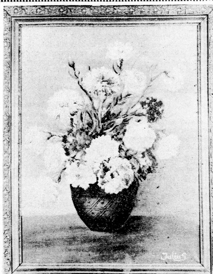
JULIUS FLEISCHER: SZÜLETÉSNAPOK