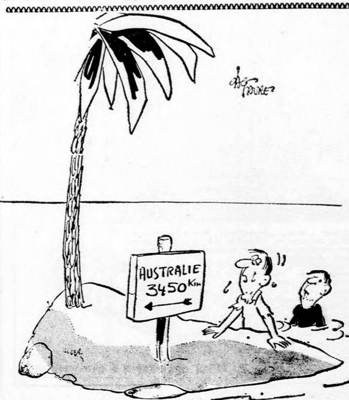
— Nem érünk vele semmit. Mi Amerikába igyekszünk... 1981.V.11

Az amerikai születésű új bevándorlók terén csak egészen jelentéktelen visszaesés mutatkozott az említett három hónap folyamán. Január-márciusban 330 amerikai olé jött hazánkba, szemben a tavalyi azonos időszakban alijjázott 356 új bevándorlóval.