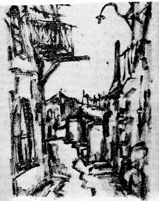
RODAN ISTVAN: A KIS TEL-AVIV

Egyébként néhány nappal ezelőtt fejezték be a datolya-csomagoló üzem építését az Árává öt szövetségi falva; Páarán (Fáarán), Cofár, Idán, Hácévá és Ejn Jáháv számára. A Szafir kőspontban létesített modern csomagoló üzemben 140 munkás dolgozik, valamennyien Jeruchámból és Dimonából jönnek ide naponta dolgozni.