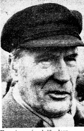
Franciaország elnöke lesz.

A törvényhozó testület elnöke felolvassa a választás eredményét és a Becsületrend légiójának elnöke Mitterrandot a Rend lovagjává avatja és széles vörös szalaggal ékesíti. Ebben a pillanatban a Szajna-parton elhelyezett 21 ágyúból diszlovéseket adnak le és Mitterrand hivatalosan