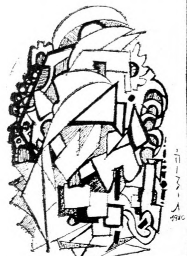
MOCSÁRI KONDOR JUDIT: Kompozíció

Amikor új stílusáról kérdezzük a művésznőt, azt válaszolja, hogy hosszú évek emberábrázolása után felébredt benne a tisztán forma és szín szerete, a tudatalatti labirintus ismétletlen utját keresve. Kihátással volt új irányzatára néhai édes-