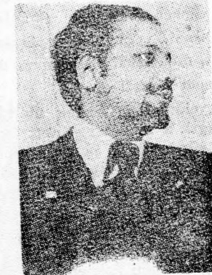
JAMANI Befagyasztott kőolaj...

Achmed Záki el-Jámáni sejk, Szaudia kőolajügyi minisztere tegnap Nyugat-Berlinben kijelentte, hogy feltételezése szerint az év végéig „befagyaszttják” a kőolajárakat és több, mint 50