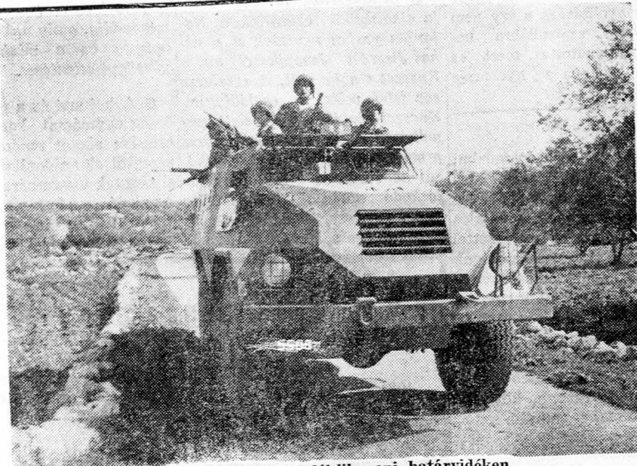
Izraeli őrfjárat a dél-libanoni határvidéken.