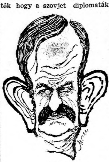
ASZAD Makaes oroszlán?

A beiruti szovjet nagykövetség közben — a Reuter hírhírnökök szerint — megkezdte a diplomaták családtagjainak evakuálását. A hírhírnökök „mértékadó beiruti köröket” idéztek ezzel kapcsolatban. Ezek a hírforrások tudni vélték, hogy a szovjet diplomaták pénteken, hogy amennyiben ki derül, hogy a hír igaz, ez igen súlyos fejlemény.