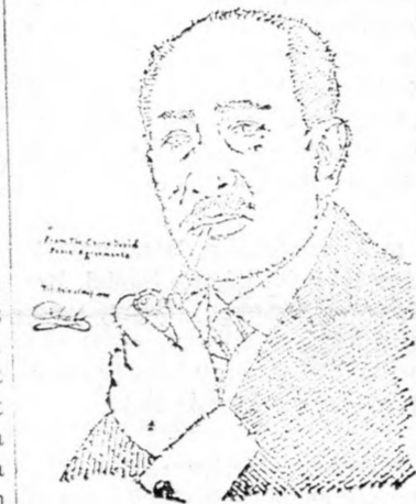
SZADÁT Tulzott optimizmus?

A szíriaiak pénteken délután a Libanon-völgyben — másodízben — SAM-6 típusú rakétával lelőttek egy pilótánélküli izraeli felderítő gépet. A szíriai katonai szóvivő — dus fantáziával — megkétszerezte a lelőtt gépek számát.