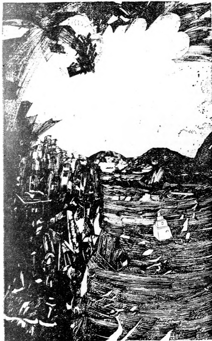
SLOMO BAGEN: SEJTELMES LATHATAR

Az IBUSZ * O.N.T. CARPATI * BALKAN TOURIST * KOMPAS hivatalos képviselői