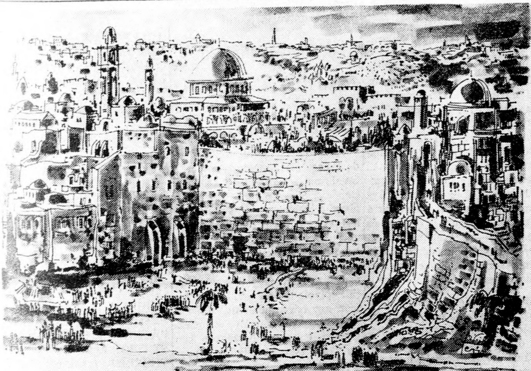
JOSZI STERN: A SIRATÓFAL