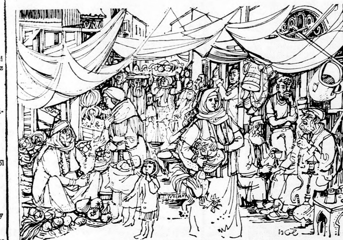
JOSZI STERN: A JERUZSALEMI PIAC