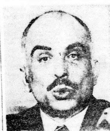
biztosítására is, hogy Jordánia az el nem kötelezett országok közé tartozik.

Huszsein király viszont más véleményen van. Szerinte az ügylet nem csak katonai szempontból szükséges, hanem annak