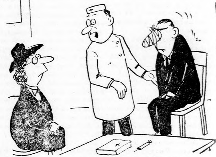
— Mióta képzeli magát a férje harkálnak?