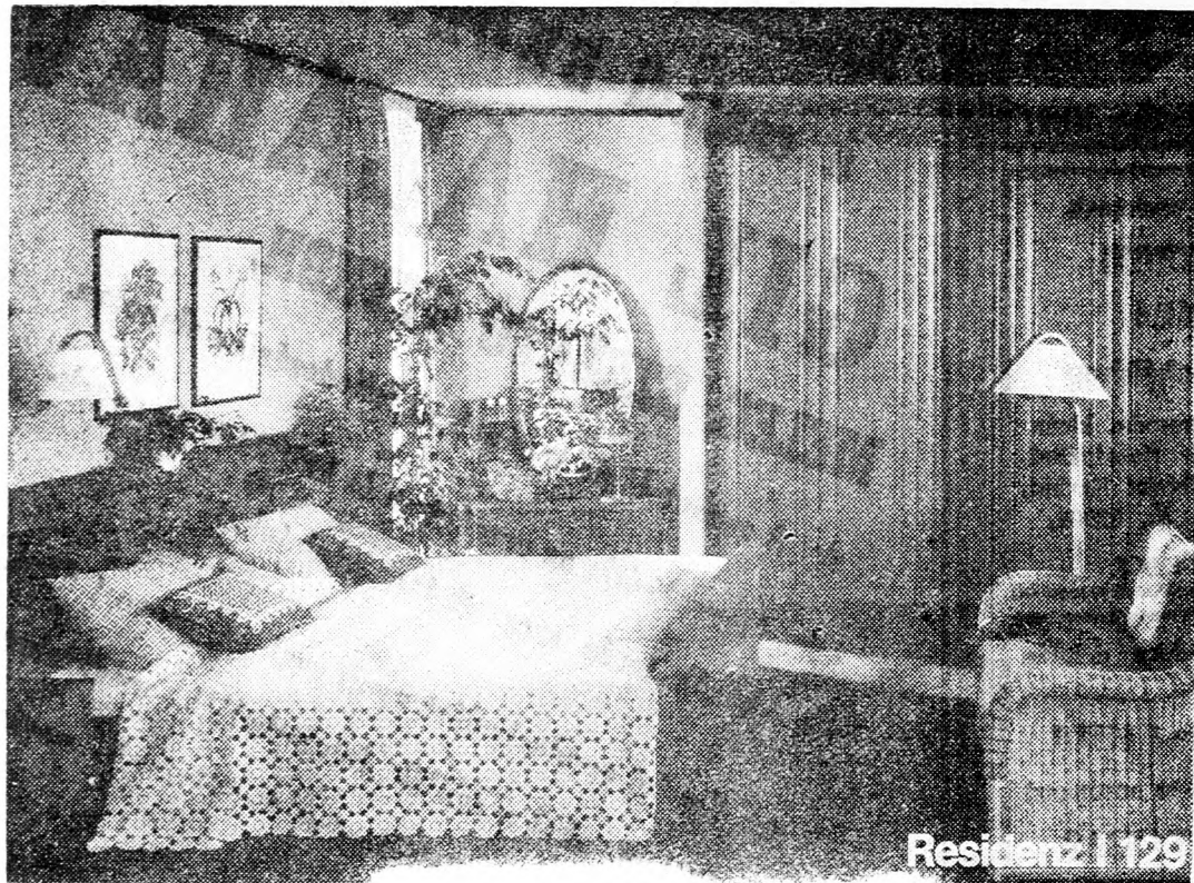
Nem régen érkezett!!

Meghívjuk Önöket az európai gyártmányu, divatos butorkiállításra 1981 május 30, szombat estétől 1981. június 15-ig.