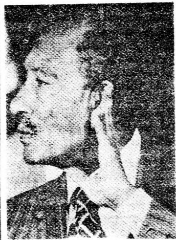
SZADÁT Elege tesz a helyi lakosok kérésének?

Az esemény miatt olyan munkákat is elvégeztek, amelyekkel Ofira lakosai hiába kértek hoszszu időn át, kiszélesítették az