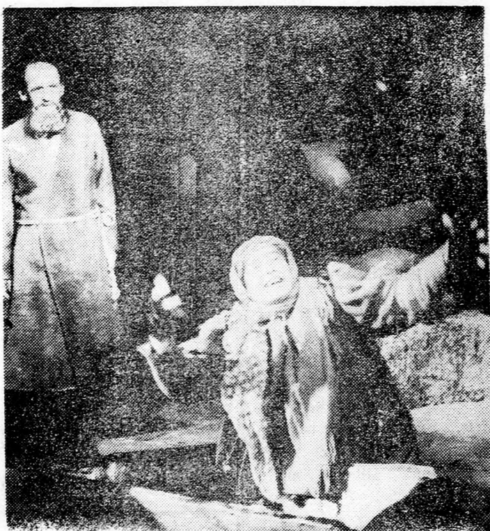
Jelenet az Izraelben szereplő varsói jiddis színház előadásából.

— Az ujonc az első két hetet Sfarámban, az iskolában tölti és elméleti alapvetést kap. Utána 3—5 hónapig egy rendőrállomáson folyik tovább a gyakorlati képzése, majd 5 hetes sporttanfolyamra megy a Natanja környékén létesített „Jáári” intézetbe, ahol csak fizikai erőlétének fejlesztésével foglalkoznak. Ezt a szakmai gyakorlat folytatása követi —, de csak egy-két hónapig, mert aztán ismét Sfarámba kerül az ujonc, ahol 16 héten át tanul. Ez már komoly tanfolyam, amelynek során kiderül, hogy annak résztvevői közül kik lesznek alkalmassak később magasabb parancsnoki tanfolyamok elvégzésére. A