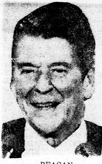
REAGAN Védelmi lépés volt...