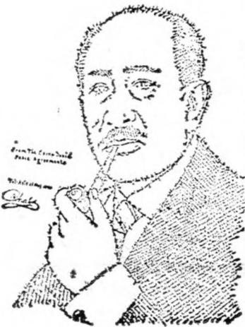
SZÁDÁT Óvatos optimizmus...

kozat keretében felfedte, hogy a közöttük és Reagan között augusztus 5-én kezdődő