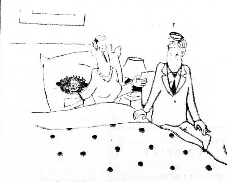
— Te, mindent olyan sötétben látsz, Mojsó.

Nyereménykönyv: LÉNÁRD SÁNDOR: Egy nap a láthatatlan házbán