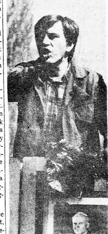
JELENET A FILMBŐL